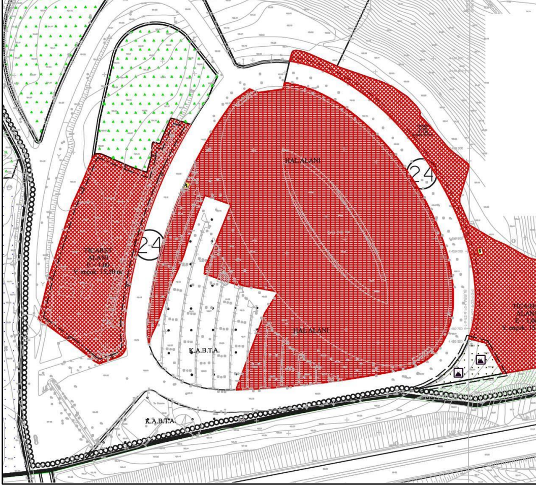
Resim 3: 1/1.000 ölçekli Bursa Hali Uygulama İmar Plan Değişikliği:

Plan değişikliği önerilen alana ait kullanımların dağılımı şu şekildedir: